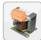
TD Transformator (Schaltschrank) (400V)