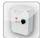
MSD ... Motorschutz- schaltgerät (400V)