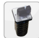
S5 Stufenschalter (Schaltschrank) (400V)