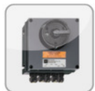
GS ... Ex Geräteaus- schalter