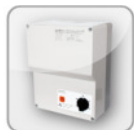
RKD ... Steuergerät 5-Stufen (400V)