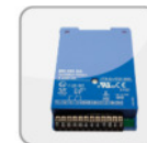
TÜS 100/A Kaltleiterauslösegerät (Schaltschrank) (400V)