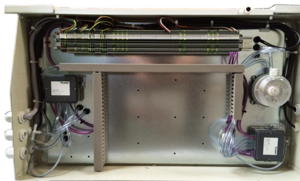
Abb.: Geräteanschlusskasten SupraBox COMFORT Typ E Baureihe D (Deckengerät) [Mit auf dem Regelungsblech montierten Feldgeräten]